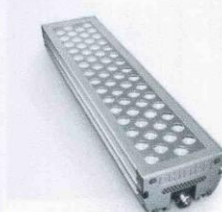
Система светодиодного освещения позволяет экономить электроэнергию в 10-15 раз по сравнению с лампами накаливания и в 2-3,5 раза по сравнению с энергосберегающими лампами.

Светодиодная система обладает следующими преимуществами перед другими существующими системами освещения: