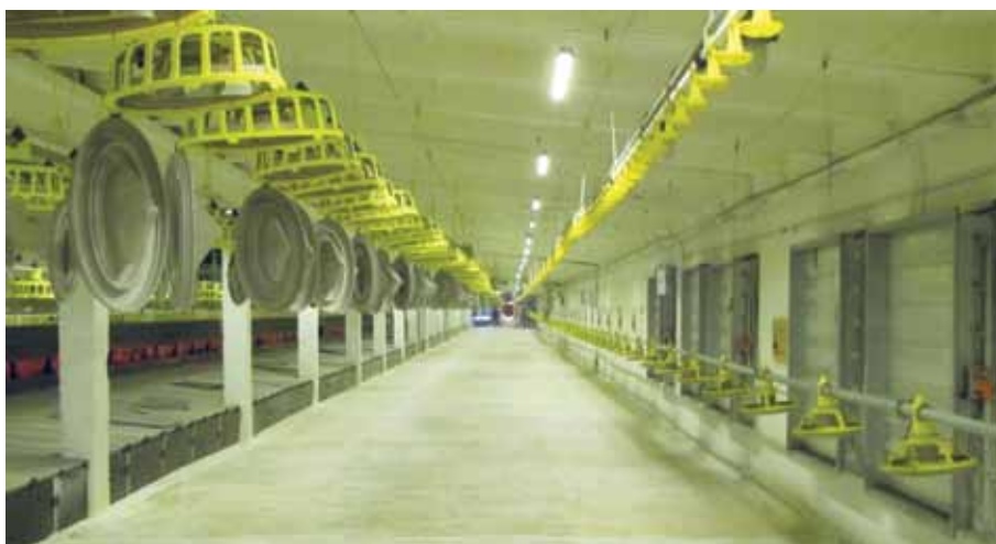
Рисунок 1. Корпуса для содержания родительского стада, 18x120 м. Система светодиодного освещения ИСО «Хамелеон», состоящая из 134 светильников СН1050-20-120-Т при высоте подвеса 2,7 м обеспечивает уровень освещенности 90-95 лк.

Применение широтно-импульсной модуляции в качестве способа управления яркостью светодиодов позволяет эффективно сокращать потребление электроэнергии в период пониженной освещенности и создавать недорогие и современные системы управления яркостью светодиодных светильников на основе программируемых контроллеров. Зависимость потребления электроэнергии светодиодной системой освещения от уровня освещенности в корпусе размером 21x93 м напольного содержания цыплят-бройлеров при высоте подвеса 3 м 130 светодиодных светильников СН1050-12-60-Х по результатам замеров представлена на рисунке 2.