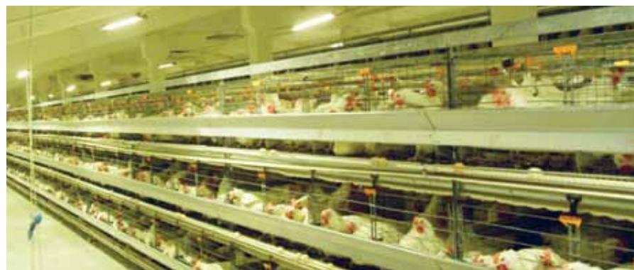
Рисунок 3. Корпуса клеточного содержания ремонтного молодняка. Светодиодные системы освещения ИСО «Хамелеон» установлены в апреле 2011 г. Уровень освещенности на нижней кормушке 60 люкс. Цветовая температура 3500 К

Тем не менее некоторые производители светодиодного оборудования решают проблему ускоренной деградации светодиодов в светильниках мощностью от 10 до 20 Вт и более при использовании внешнего корпуса полностью из полимерных материалов, обладающих плохой теплопроводностью, избыточным количеством светодиодов в светильнике. В отдельных случаях на начальном этапе