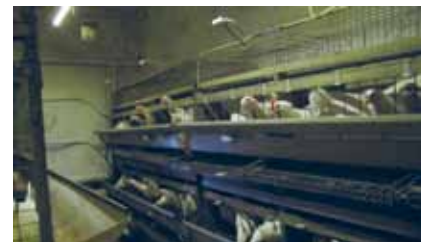
Рисунок 9. Виварий Загорского экспериментального племенного хозяйства ВНИТИП г. Сергиев Посад. Исследования проводятся на оборудовании ИСО «Хамелеон»

на начальную и среднюю несушку – на 9,8-16,0 и 9,1-12,6%, массу яиц – на 1,9-2,9%, выход яиц категорий высшая, отборная и первая – на 1,1-1,2; 2,1-6,0 и 5,4-7,3%, выход яичной массы на начальную и среднюю несушку – на 12,8-17,8 и 12,4-14,2% при снижении затрат корма на 10 яиц и 1 кг яичной массы на 8,6-11,7 и 10,9-12,7% соответственно. Эффективность локального освещения светодиодными светильниками белого теплого спектра освещения (2700-3500 К) подтвердилась и при выращивании цыплят-бройлеров.