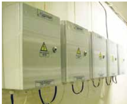
Рисунок 8. Блоки сопряжения из состава светодиодной системы освещения ИСО «Хамелеон». Металлический шкаф обеспечивает оптимальный температурный режим работы электронного оборудования для максимального продления срока службы

покрытия металлических частей, а также использованием коммутационных коробок из устойчивых к щелочным и кислотосодержащим средствам полимерных материалов с классом IP 66. Герметичность коммутационных коробок и металлических шкафов обеспечивается применением винтовых соединений и резиновых прокладок. Таким образом, мойка светильников в отличие от люминесцентных ламп и ламп накаливания может осуществляться персоналом без специального допуска, во включенном состоянии и полностью безопасна. Пониженное напряжение питания также считается одним из способов повышения пожаробезопасности.