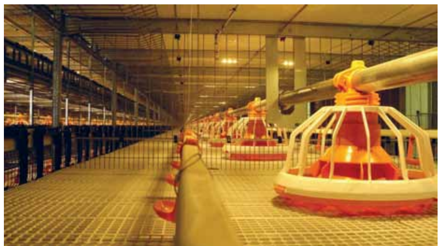
Рисунок 7. Светодиодное освещение при клеточном выращивании цыплят-бройлеров. Светильники располагаются над каждой кормушкой и создают максимальный уровень освещенности до 100 лк на кормовом фронте. Пространственное разнесение светодиодов и расположение светильника поперек длины батареи позволяет, кроме того, создать необходимую освещенность на поилках

Особо хотелось бы выделить светодиодное оборудование, предназначенное для использования при клеточном выращивании цыплят-бройлеров. С одной стороны, это существенное сни-