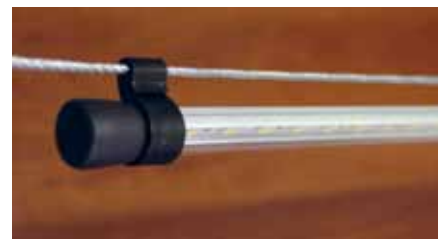
Рисунок 5. Один из вариантов светодиодного светильника ИСО «Хамелеон». Алюминиевая часть корпуса позволяет соблюдать оптимальный тепловой режим работы светодиодов, а крышки из полимерных материалов обеспечивают герметичность по классу защиты IP-66

всего лишь на 10 градусов приведет к сокращению срока службы светодиода примерно на 20 000 часов (более 2 лет непрерывной эксплуатации). В данном случае важно то, что даже достаточно небольшое снижение температуры приводит к существенному увеличению времени «жизни» светодиода при фиксированном рабочем токе. Соблюдение температурного режима работы источника освещения обеспечивается применением специальных технических решений, направленных на максимальное снижение разницы температур окружающей среды и светодиода. Для помещений, где содержится птица, это очень важно, так как температура в птичнике может достигать до +40...+45 °С. Наиболее экономически и технически целесообразным в данном случае способом является применение алюминиевого радиатора в конструкции корпуса светильника, на котором крепится плата со светодиодами, имеющего непосредственный контакт с окружающей средой. Таким образом, здесь «отвоевывается» каждый градус температуры кристалла, что позволяет максимально продлить срок службы источника освещения. Если проанализировать конструкции светодиодных светильников ведущих мировых производителей, видно, что при мощности осветительного прибора от 5-10 Вт и выше в его корпус обязательно входит алюминиевый теплоотвод. Естественно, что в нашем случае должны соблюдаться и требования к корпусу по обеспечению герметичности.