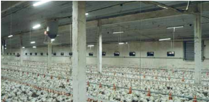
Рисунок 6. Корпуса напольного содержания бройлеров на площадке Балахоновская. Светодиодные системы освещения ИСО «Хамелеон» установлены в сентябре – октябре 2009 г. Уровень освещенности в среднем 45-46 люкс. Цветовая температура 5500 К

уровень освещенности таких приборов превышает заданный в 1,5-2 раза. Данный способ неэффективен экономически, так как возрастает стоимость оборудования. Кроме того, из-за нелинейной зависимости деградации светодиодов от температуры срок службы таких светильников все равно снижается на 20-30%.