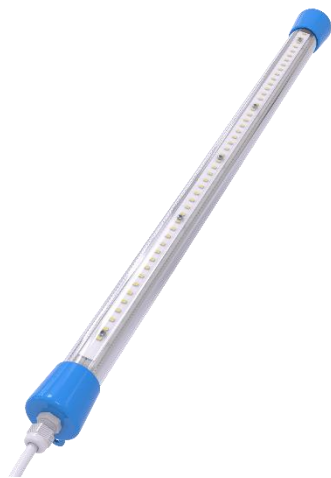
Рис. 1. Внешний вид светильника.