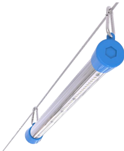
Рис.2. Крепление светильника на трос при помощи карабина.